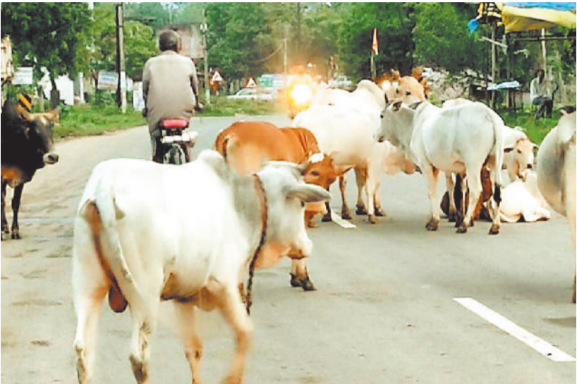
सड़क पर विचरण करते मवेशी।

सड़क से मवेशियों को हटाने की सारी कवायद फेल होती दिखाई देती है। नगर पालिका क्षेत्र बैकुण्ठपुर एवं शहर क्षेत्र से लगे ग्रामीण क्षेत्र से गुजरी मुख्य मार्ग पर आसानी से सुबह से लेकर शाम ढलने के बाद तक मवेशियों का विचरण प्रतिदिन किसी न किसी क्षेत्र में देखा जा सकता है। सड़क पर मवेशियों के विचरण एवं विचरण के कारण वाहन चालकों को परेशानी होती है साथ ही सड़क पर मवेशियों के रहने के कारण उनके दुर्घटना होने की बराबर संभावना बनी रहती है।