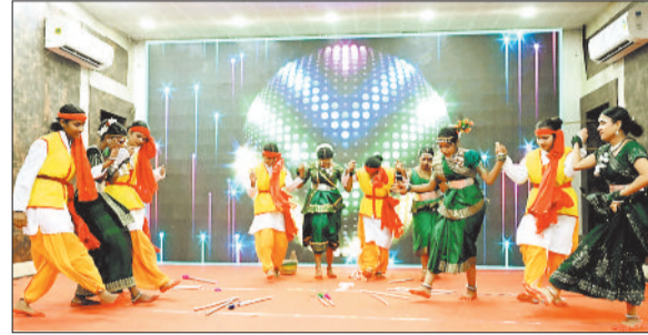
नृत्य की प्रस्तुति देते विद्यार्थी।