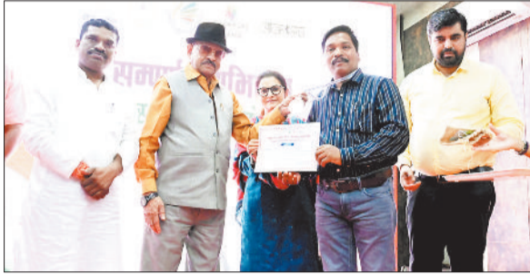
विधायक के हाथों सम्मानित होते अधिकारी।

इस अवसर पर जिला पंचायत ऑडिटोरियम में संपूर्णता अभियान सम्मान समारोह का आयोजन किया गया। इस अवसर पर जिला स्तरीय समारोह का गत वर्षों की भांति आयोजन के लिए 5 अगस्त को शाम 5:30 बजे से कलेक्टर सभागार में बैठक का आयोजन किया गया है। इस बैठक में सर्व संबंधित अधिकारियों को समय पर उपस्थित होने के लिए कहा गया है।