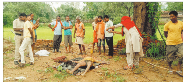
मौके पर जांच करती पुलिस की टीम।

उपयोगी बताते हुए कहा कि सभी अधिकारियों को चाहिए कि वे वित्तीय नियमों के अनुरूप कार्य करें और लंबित प्रकरणों का शीघ्र निराकरण करें। ऐसी कार्यशालाएं अधिकारियों के कौशल संवर्धन में सहायक सिद्ध होती हैं। कार्यशाला में जिले के विभिन्न विभागों से काफी संख्या में आहरण एवं संवितरण अधिकारी उपस्थित रहे।