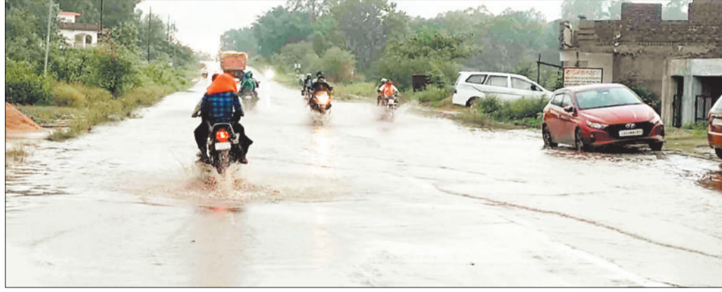
बारिश के दौरान एनएच पर जमा पानी।

अंबिकापुर से पत्थलगंव तक करोड़ों की लागत से एनएच 43 पर सड़क सहित नाली का निर्माण किया गया है। शांति पारा एनएच 43 के किनारे बनी नालियों के जाम होने से बारिश होते ही पानी सड़क पर ही एकत्र हो जाती है जबकि बड़ी संख्या में भारी वाहन समेत चार व दोपहिया वाहन आवागमन करती है। सड़क पर पानी होने से बाइक, स्कूटी सवार के गिरने तथा दुर्घटना प्रस्त होने की संभावना बनी रहती है। पानी का जमाव से मुख्य सड़क तालाब में तब्दिल हो रहा है जहां तेज रफ्तार वाहन खासकर हाइवा, ट्रक के चलने से सड़क पर जमा पानी के छिटकने से स्कूल आने जाने वाले बच्चों के ड्रेस गंदे हो जाते हैं। इसके अलावा